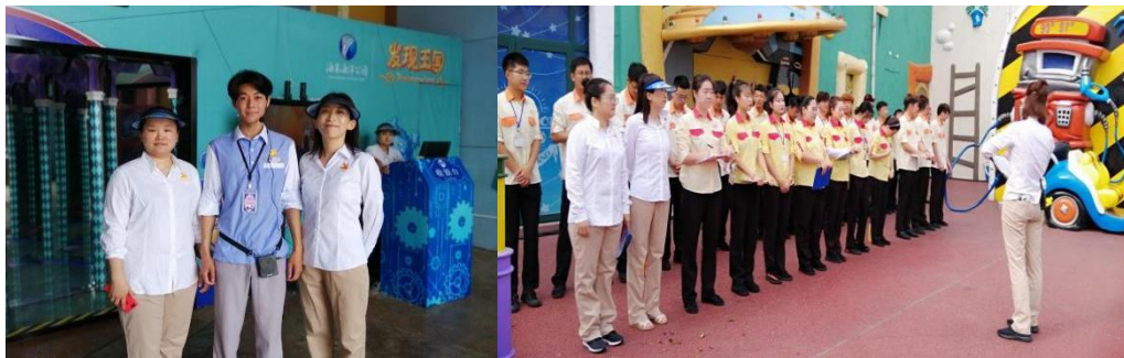
图 4 教师参加企业顶岗实践