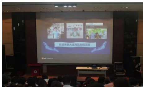
图8 进行线上宣讲会

（四）开拓校企合作新思路。 利用现有校企合作资源，为企业开拓竞品交流平台，开拓校企合作新思路，不仅仅在人才培养和录用发挥稳定作用，对企业发展带来强大的助力。