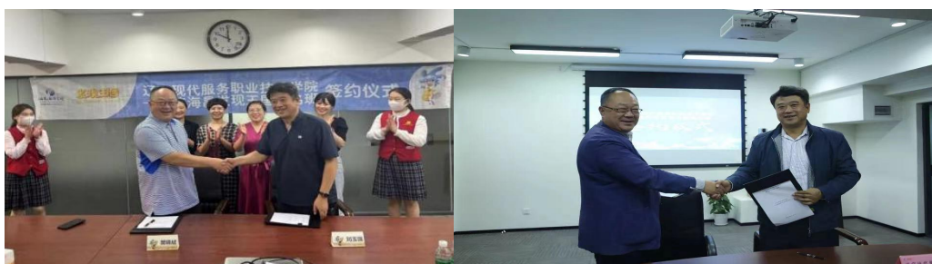
图7 校企合作冠名班签订

（五）校企携手深化教育教学改革。 开展订单培养，解决学生对口就业问题，真正实现校企双主体育人。将学生职业认知、职业体验、职业磨练、职业实战与企业生产服务流程及产品价值创造过程有机融合起来，学中做、做中学、学做一体。面向旅行社和景区真实环境，改革教学方法、手段，激发学生学习的积极性。校企联合共同举办职业技能竞赛，将企业岗位技能标准融入技能竞赛，实现以赛促教、以赛促学、学赛结合。创新人才培养模式，提升人才培养质量。