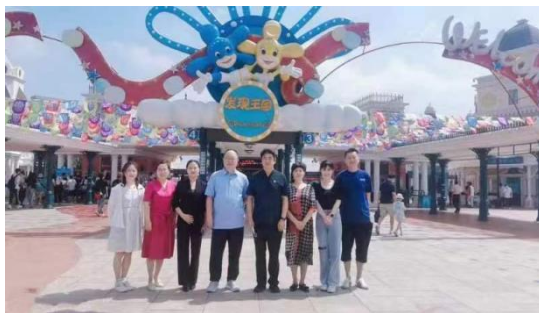
图 5 校领导到企业看望实习生

学校为企（行）业实施“订单”培养，向企（行）业输送具有良好职业素质和较高技能的人才；争取更多的优质企业在学校设立“奖学金”，为学校提供实习实训就业基地。