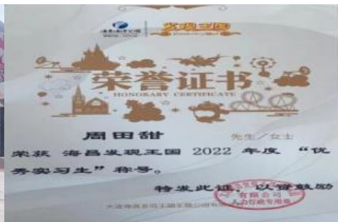
图 6 学生获得优秀实习生证书