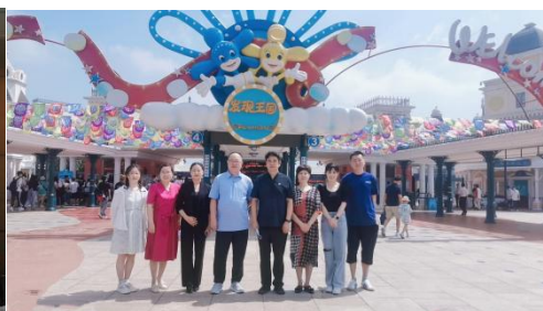
图9 校企高层领导牵头未来合作