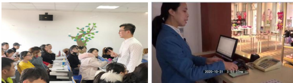
图3 企业培训讲师为实习生授课

企业建立一支相对稳定、水平较高、结构合理的兼职教师队伍，建设一支结构合理、素质优良、相对稳定、富有活力、具有创新精神和较高教学水平的稳定的兼职教师队伍，使学校专业师资队伍的整体素质保持在全省乃至全国同类院校的一流水平。